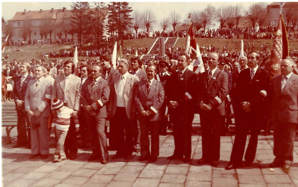
Fot. 2. Działacze MKK NSZZ „Solidarność” w Miastku podczas mszy 9 maja 1981 roku